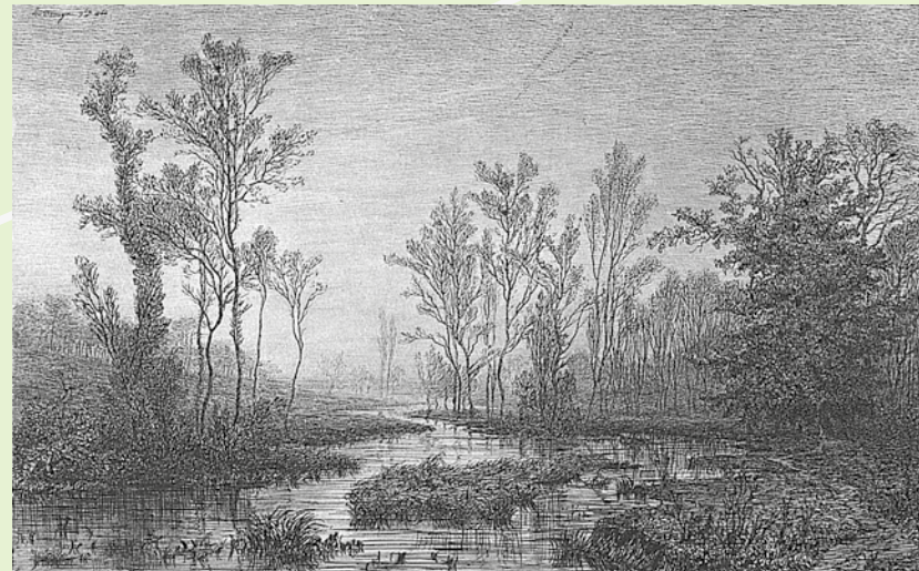
Un paysage d'eau et d'arbre gravé par Leo Drouyn en 1859 pour L'Artiste (dir. Théophile Gautier).