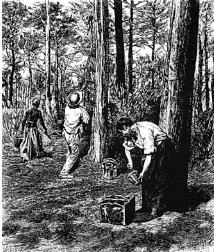
Le gemmage, gravure de Paul Kaufmann (1880).

Dans son environnement, le moulin de Labarie sur le Ciron.